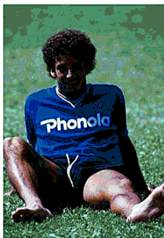
Gianluca Vialli La storia del campione